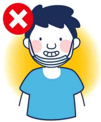
턱에 걸치는 착용