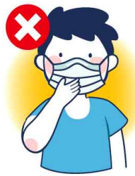
걸을 만지는 행위