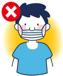
입만 가리는 착용