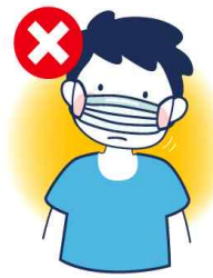
코만 가리는 착용